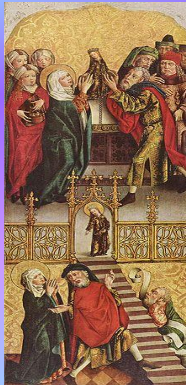
Введение Богородицы во храм (Мастер Алтаря Реглера, XV век)

Когда Марии исполнилось 3 года, родители привели трёхлетнюю Марию в храм, чтобы исполнить данный богу обет. Христиане отмечают это событие, как двенадесятый праздник «Введение во храм пресвятой богородицы» (4 декабря).